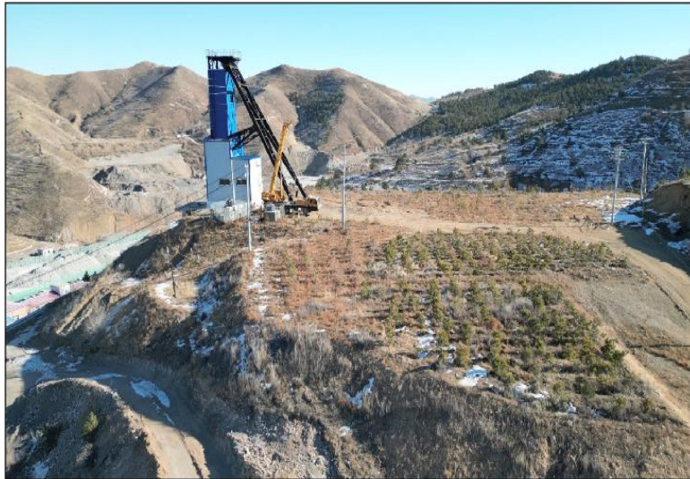
照片 4-5 主箕斗井（原风井 FJ5）平台

经过前期治理，矿山地质环境得到了很大程度的改善，应治可治的破坏单元基本治理完成，但局部治理效并不理想，复垦效果较差。