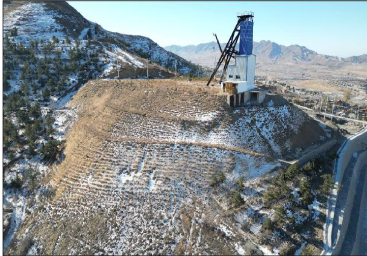
照片 4-4 主箕斗井（原风井 FJ5）垫方边坡