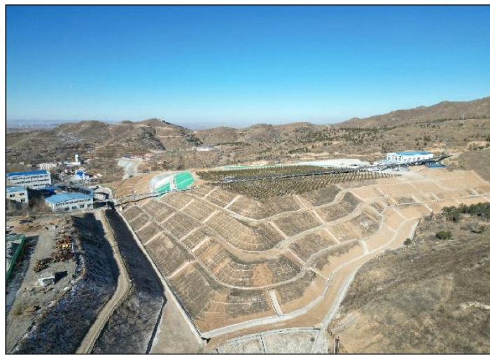
照片 4-2 2#尾矿库