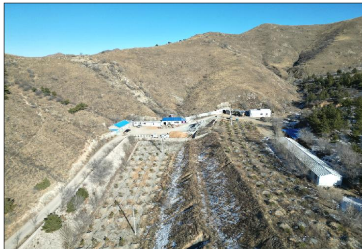
照片 4-3 白金线平硐 (PD1) 工业场地